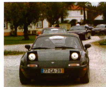
Entre os cerca de 40 modelos, exemplares da 1.ª geração do MX-5, lançada em 1989