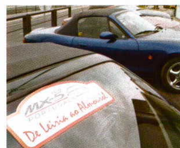
Esta iniciativa assinalou o regresso à ação do Club MX-5, após paragem (muito) longa