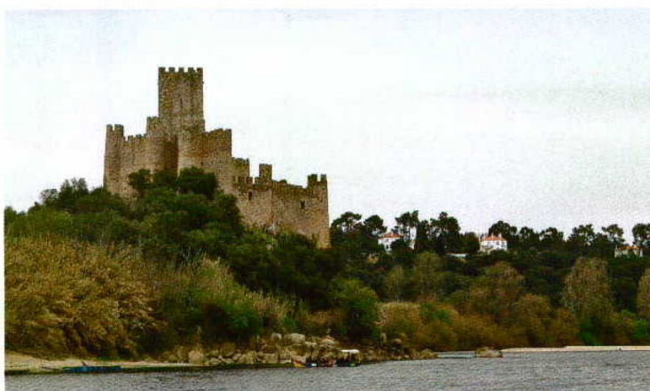
Sabe-se pouco sobre a origem de castelo que já existia quando os mouros foram expulsos

ções, do original de 1989 ao automóvel mais recente, apresentado em 2005. Segundo números da organização, na partida, em concessionário da marca na cidade do Liz, compareceram 15 descapotáveis com matrículas anteriores a 2000!