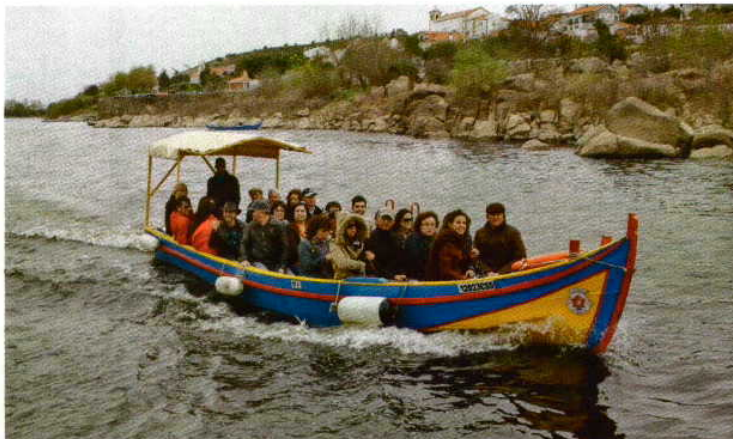
Como os «roadsters» não... nadam, viagem de barco até à ilha de Almourol, no rio Tejo

Neste passeio, que proporcionou muitos momentos de confraternização e alguma aventura, inclusive ao volante – desafio de orientação pedestre para descoberta dos encantos e recantos da deslumbrante Herdade de Cadouços, em Água Travessa, na freguesia da Bemposta, no concelho de Abrantes (600 hectares no coração do Ribatejo, com hotel rústico, oito lagos azuis e muito, muito campo!) –, encontraram-se modelos das três gera-